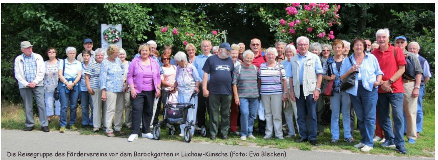
Die Reisegruppe des Fördervereins vor dem Barockgarten in Lüchow-Künsche

Zufrieden mit dem erlebnisreichen Tag und vielen schönen Orchideen im Gepäck kamen die Teilnehmer wieder in Winsen an.