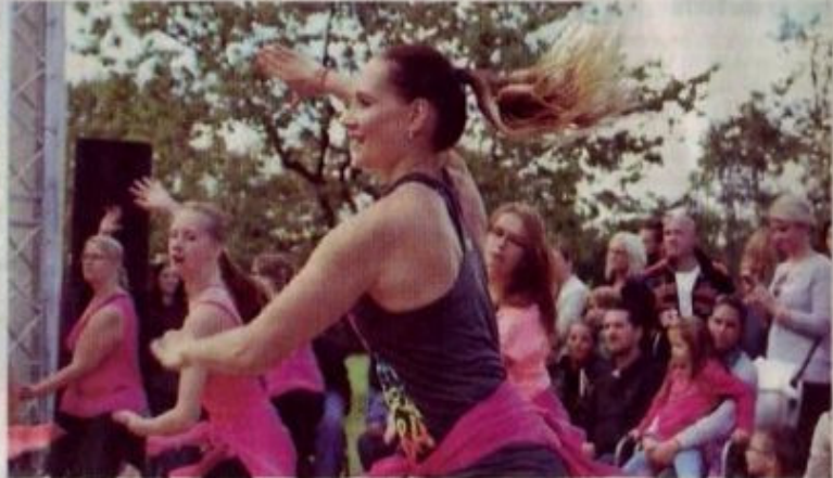
Die Tanzschule Erdle unterhielt mit einem abwechslungsreichen Programm, so gab es auch Zumba-Impressionen zu sehen.