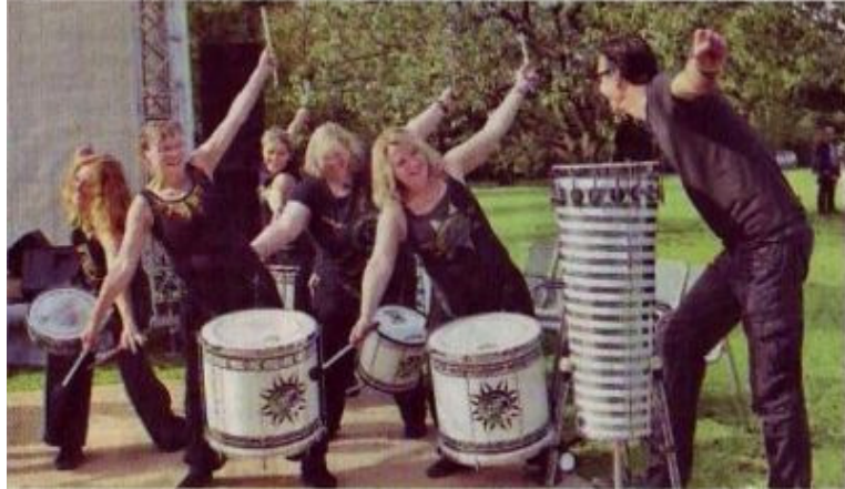
Wie schon beim Stadtfest begeisterte auch beim Dahlientag die Trommelgruppe Sambucada mit einer lebendigen Performance und tollen Trommelrhythmen.